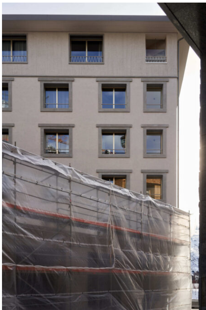
Ansicht von Norden