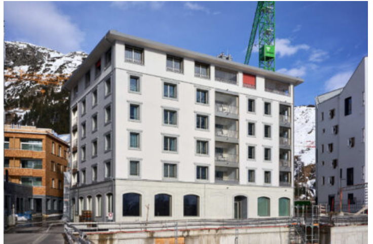
Ansicht von Süden

Das MFH Pazola in Andermatt Reuss beherbergt insgesamt 19 Wohnungen mit 3.5 und 4.5 Zimmern. Im Erdgeschoss gibt es zusätzlich einen Retail-Bereich und ein Spa für die Bewohner.