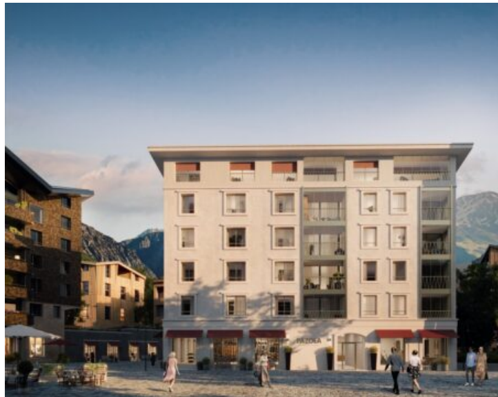
Pazola in Andermatt

Die gesamte Konstruktion über dem Erdgeschoss, einschließlich des Daches, besteht aus Holzelementen. Auch die Fassade wurde konstruktiv aus Holzelementen erstellt und ist mit einem hochwertigen mineralischen Putz auf hinterlüfteten Putzträgerplatten verkleidet. Die Bauweise in Holz bot zahlreiche Vorteile. In Andermatt ermöglicht es die kurze Bausaison optimal zu nutzen, da vorfabrizierte Elemente den Rohbau in einer Saison abschliessen lassen. Zudem minimiert Holz als nachhaltiges Material die Umweltbelastung durch seine guten Dämmwerte, CO 2 -Negativität und die Möglichkeit zur zerstörungsfreien Demontage und Wiederverwendung.