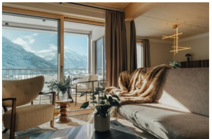
Beispiel 4.5 Zimmer Wohnung