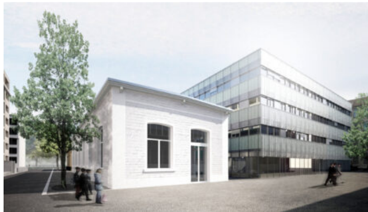
Diesellokal und Neubau

Daneben wird ein flexibler Neubau für stilles Gewerbe und Dienstleistungsnutzungen mit einem Erd- und drei Obergeschossen erstellt. Gebäudeabmessungen, Struktur und Erschliessung sind auf eine flexible und funktionale Unterteilbarkeit der Mietflächen ausgelegt, das Angebot beinhaltet Einheiten zwischen 20 und ca. 450 m 2 . Im Erdgeschoss sind alternativ zu den Gewerbe- und Büronutzungen gemeinschaftlich nutzbare Flächen vorgesehen. Es wird zwischen einem Grund- und einem Standardausbau unterschieden, womit im Innenausbau unterschiedliche Mieterwünsche und Ausbaustandards berücksichtigt werden können. Das Gebäude wird teilweise unterkellert, im Untergeschoss sind neben den Technikflächen (Übergabestationen Fernwärme und Elektroinstallationen, Brauchwarmwasseraufbereitung, Lüftung) vermietbare Kellerräume vorgesehen. Die Tragstruktur besteht aus einem Skelettbau in Massivbauweise, der dezentral an der Nordfassade angeordnete Kern enthält nebst der Erschliessung alle