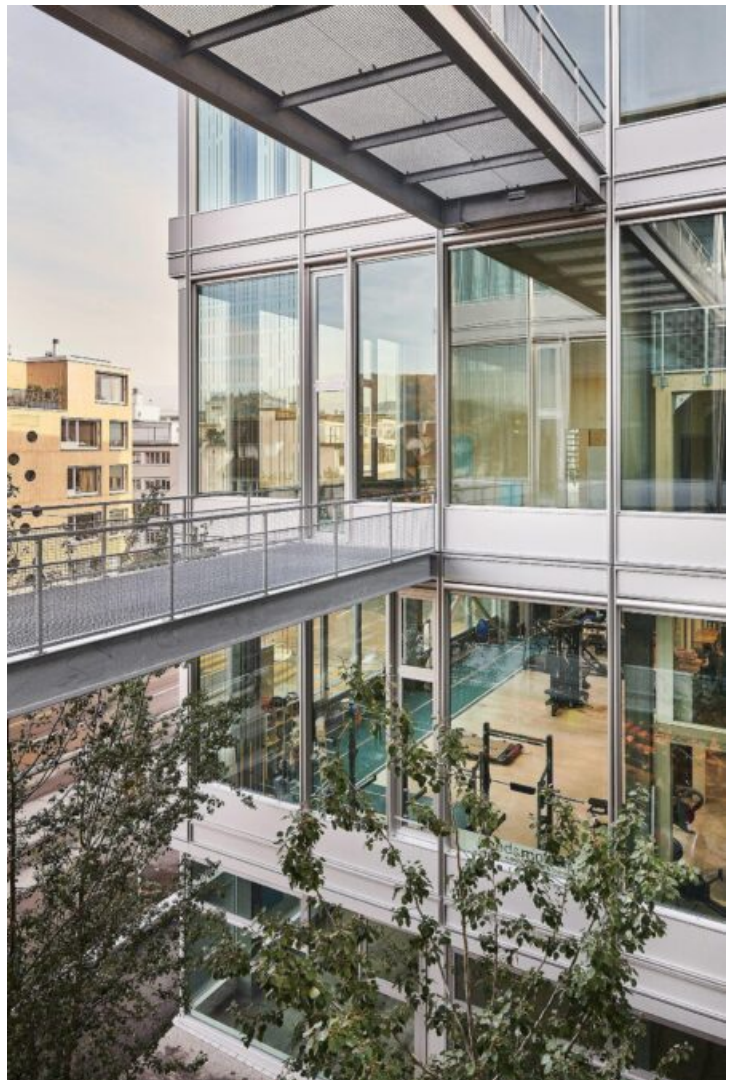
Zwischenraum (Zeljko Gataric)